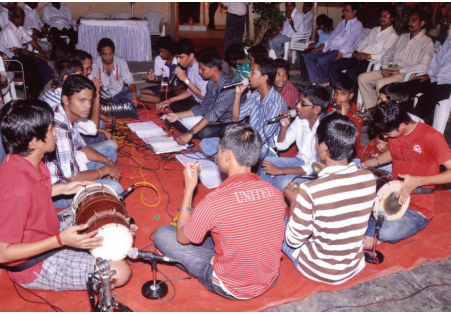
आषाढी कार्तिकी एकादशी निमित्त भजनात तल्लीन झालेले भक्तगण